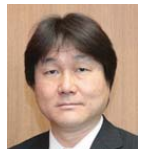
高橋勝浩 (稲城市長)