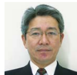
加藤永 (国土交通省 都市防災対策推進室長)